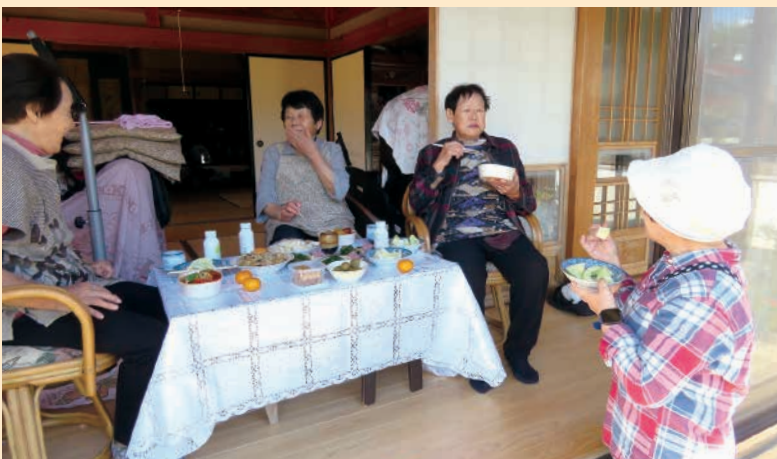
<福祉委員 佐良土南自治会ささえあいカルテより>