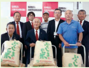
白河小峰・大田原 ライオンズクラブ様