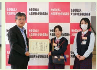
宇都宮ヤクルト販売株式会社様