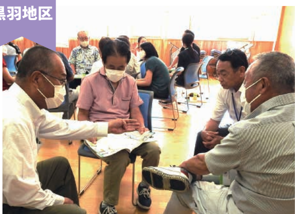
ハザードマップを使ってみんなで再確認 ～防災講座～