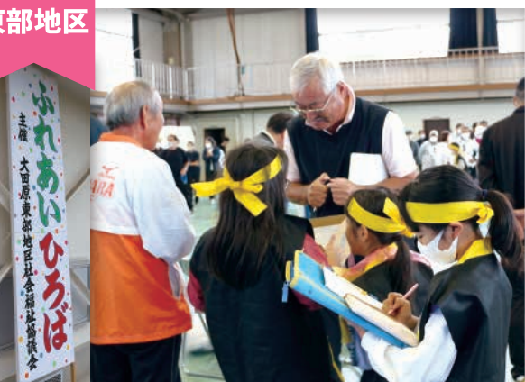
地域の交流、小学生との交流 ～ふれあいひろば～