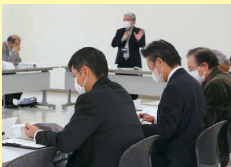
推進委員会の様子

推進委員会委員の想い、そして地域住民一人ひとりの想いを受け、策定委員会で第4次計画の策定が進んでいます。