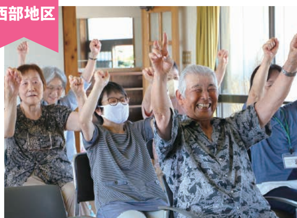
みんなで体操!みんなで元気に! ～浅野自治会 茶話会～