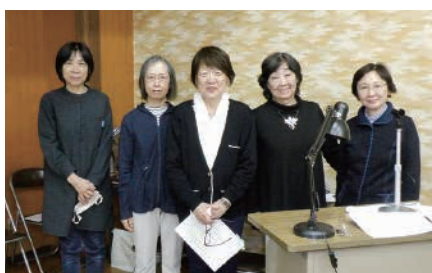
ガイドを務めた「ひびき」のみなさん

去る10月14日に、創立40周年を記念して、映画の場面や登場人物などの説明を音声にして伝える「音声ガイド付き映画会」を開催しました。同じ会場内で音訳ボランティア「ひびき」のメンバーが、リレー方式で台本を読みあげます。目が見えない、見えにくい方も、そうでない方も一緒に同じ映画を楽しみました。参加した方からは、「ガイド付き映画を初めて観た。」「ガイドがあることで内容をイメージし易かった。」など、とても好評でした。