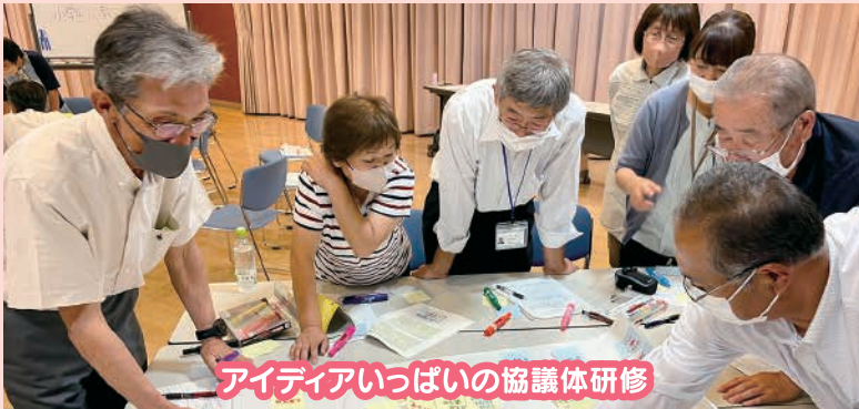
アイデアいっぱいの協議体研修

各地区の第2層生活支援コーディネーター(SC)が地域の良いところを見つけたり、地域の様々な活動や人をつなげたりしながら、調整役として活躍しています。