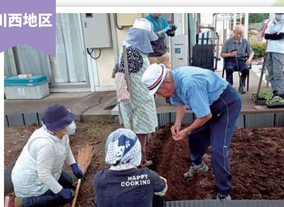
施設の方と地域と一緒に花だんづくり ～かをる hanaサロン～