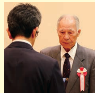
感謝状贈呈の様子