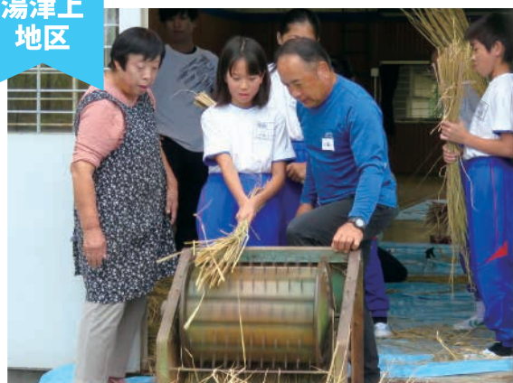
昔ながらの伝統行事を子ども達へ ～豊年棒(ぼうねんぼう)作り～