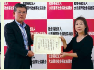
国際ソロプチミスト那須様