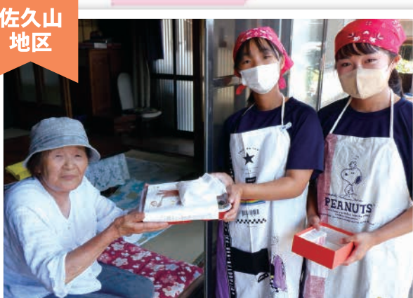
地域とつながる愛情いっぱいのお弁当 ～ふれあい型食事サービス活動～