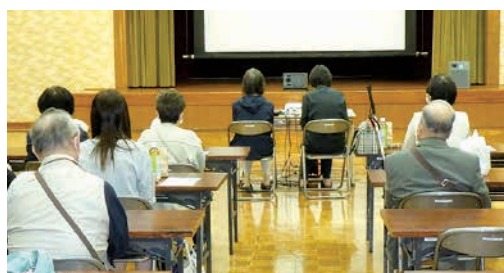
音声ガイド付き映画会の様子