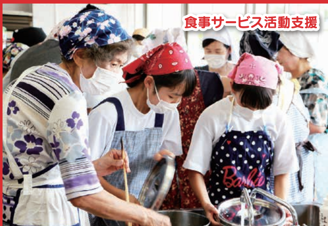
食事サービス活動支援