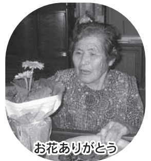
お花ありがとうございます