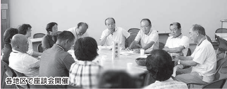
各地区で座談会開催

現在進めている第二次地域福祉計画・地域福祉活動計画(平成26～30年度)の進捗状況を把握するため、推進委員会を開催しました。今回の委員会は本計画の2回目の委員会として、委員30名がグループに分かれて、計画推進の「中間評価」を行い、目標に向けた現在の状況と今後の計画の進め方について話し合いました。 日頃地域で活動している委員の皆様から、「こんな活動はうまくいっている」「この活動にはこんな課題がある」「こんな工夫をしては」と意見が出されました。この後、8月末から市内12の地区社協ごとに地域座談会が開催され、たくさんの方の意見やアイデアが出されました。