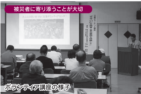
被災者に寄り添うことが大切