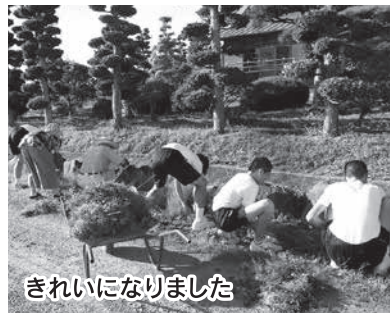
きれいになりました