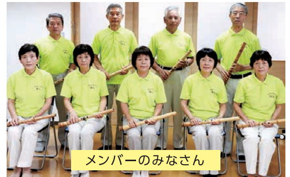
メンバーのみなさん

年配の方には古き良き日々を思い浮かべられる時間を、子どもたちには日本の文化に触れる時間を提供できればと考えています。