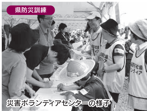
県防災訓練 災害ボランティアセンターの様子

近年、大雨災害等が全国で発生しており、私たちの住む大田原市もいつ災害が起こるか分かりません。そのような中で、災害が起きたときに、私たちに何ができるのか、どう動けばよいのかを学ぶため、8月27日に、中田原工業団地にて、栃木県・大田原市総合防災訓練が開催されました。 当日は市内で震度7の地震が発生したことを想定し、災害発生初期訓練・応急救出救助・消火、応急復旧と、災害対応の流れで訓練が行われました。市社協は、スタッフとボランティアに分かれて災害ボランティアセンターの設置運営訓練を行い、災害時に自