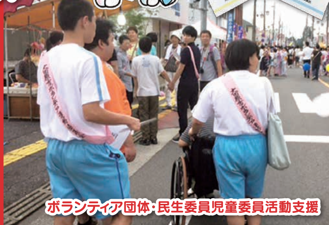
ボランティア団体・民生委員児童委員活動支援