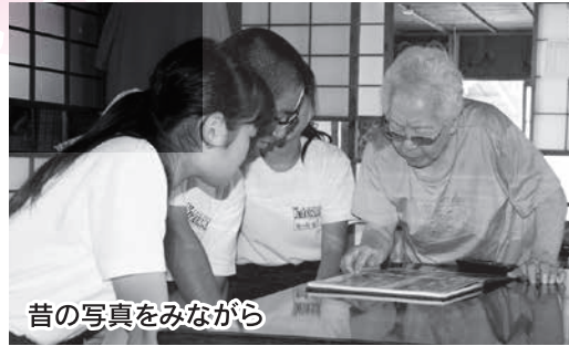
昔の写真をみながら

8月23日JA親園支店付近の歩道で、ちかその思いやり隊は、認知症徘徊声掛け訓練を行いました。昨年度の認知症による行方不明の方は、一万二千一百人、警視庁資料より、年々増加傾向にあります。例えば、認知症の方が徘徊していた場合、近隣住民がいち早く発見し、行政や警察等と連携し、無事に帰れるよう協力することがとても重要です。既に各地区の見守り隊員が保護する等の活動実績もあります。今回の訓練では、認知症の方に声をかける際の注意点を地域包括支援センターの職員から説明を聞き、歩道を歩いている徘徊者役に隊員が実際に声かけを行いました。