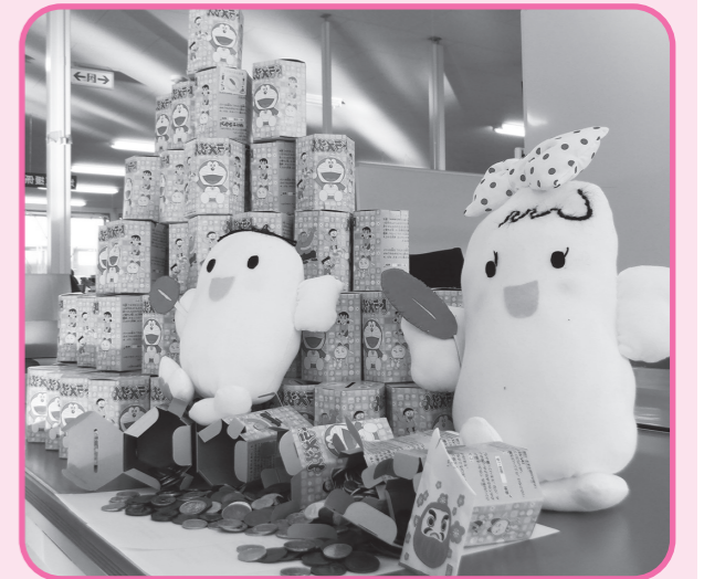
みなさんからお預かりした募金です。

地域にはいろんな困りごとや問題があって、それを解決するために活動している人たちがいます。 ふくし共育では、児童・生徒のみなさんと地域の 方が、ひとつのテーマについて、なにかできることはないか、一緒に考えていきます。