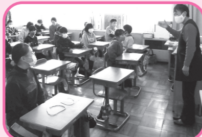
うす ぼしゅうがっこう ねんせい 薄葉小学校5・6年生