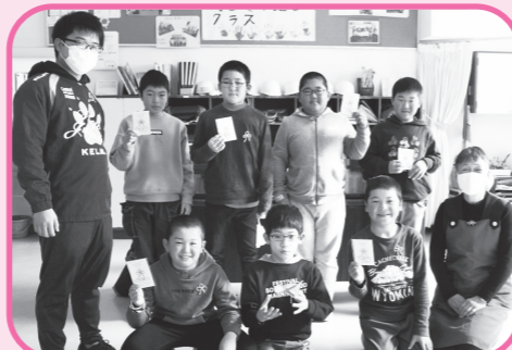
ひる たしゅうがっこう ねんせい 蛭田小学校4年生