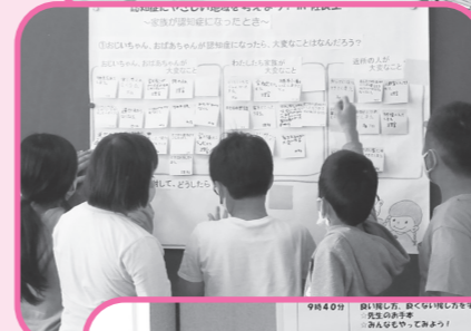
くろばねしょうがっこう うえ 黒羽小学校(上)、 さらいちしょうがっこう ひだり 佐良土小学校(左)、 すねがわしょうがっこう した 須賀川小学校(下) では、認知症にやさしい地域を考えました!