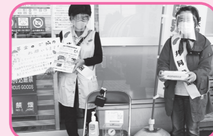
録音した中学生の募金呼びかけの声を流しながら、地域のみなさんが街頭募金活動をしました！

募金のご協力 お願いします!! 募金していただいたお金は 食事サービスや災害支援に使われ 大田原市をよりよくしていくために 1人1人の協力が必要です! あなたがいざ協力をお願いします!