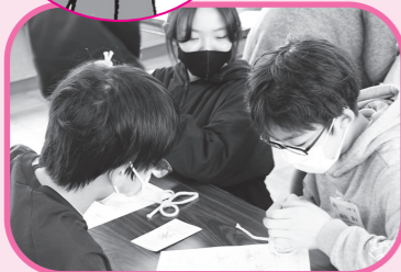
DS8きつしゅうこう ねんせい 紫塚小学校6年生