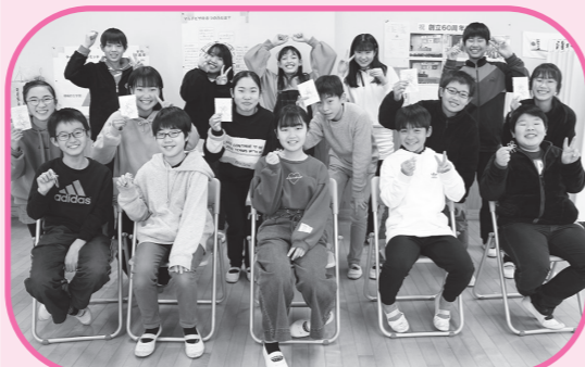
にしはらしょうがっこうたいひょういん 西原小学校代表委員