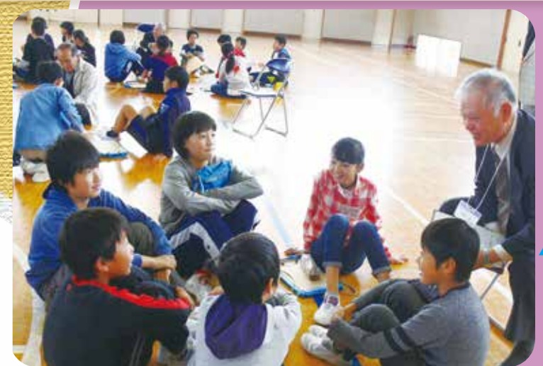
地域の方も仲良くなりました

「認知症の方々が心地よく生活するためにできることはなんだろう」紫塚小学校5年生が地域の方と一緒に、グループワークなどを通して考えました。