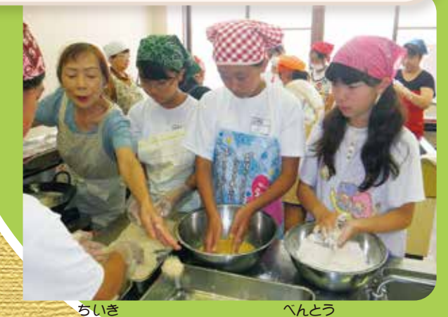
地域のみなさんとお弁当づくり

食事サービス体験 大田原中学校 西部地区社会福祉協議会 親園中学校 紫塚地区社会福祉協議会 佐久山中学校 親園地区社会福祉協議会 佐久山地区社会福祉協議会