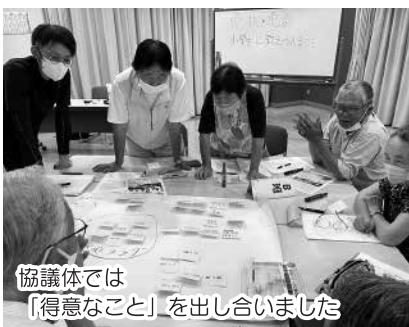
協議体では「得意なこと」を出し合いました

6月の協議体では、地域の情報を集める研修を行いました。委員のみなさんからは、活発な意見が飛び交いました。今後はさらに情報を集め、それらを生かした活動になるよう、金田の皆さんと共に取り組んで参ります。