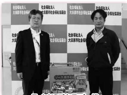
ライオンズクラブ 様