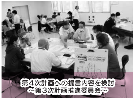
第4次計画の提言内容を検討 ～第3次計画推進委員会～

市と市社協では「おたがいをおもいやりたのしくわらってくらせるまち大田原」を基本理念とし、市民、地区社協、福祉施設、ボランティア等、関係機関・団体の皆様と共に考え、話し合い、第4次計画(令和6年～10年)の策定を進めています。 第4次計画では、第3次計画推進委員会から10個の提言を受け、4つの基本目標を掲げ、基本施策ごとに①住民の取組、②施設・団体の取組、③市社協の取組、④市の取組を示します。