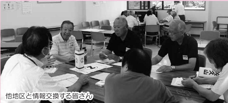
他地区と情報交換する皆さん