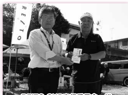
REITO CUP実行委員会 様