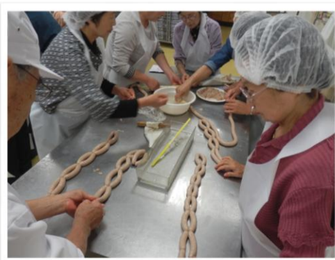
給食部会の研修旅行 食の安全講習を受けて作業体験