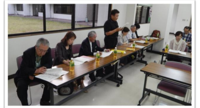
事業計画を発表する事務局