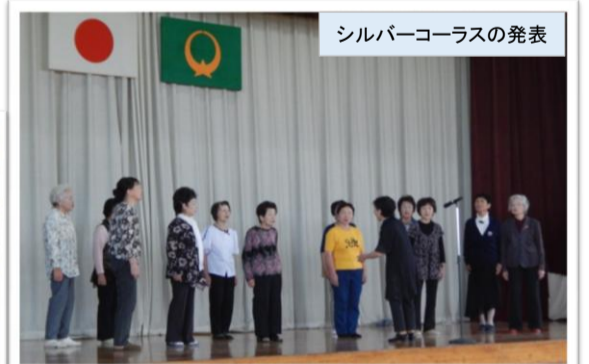
シルバーコーラスの発表