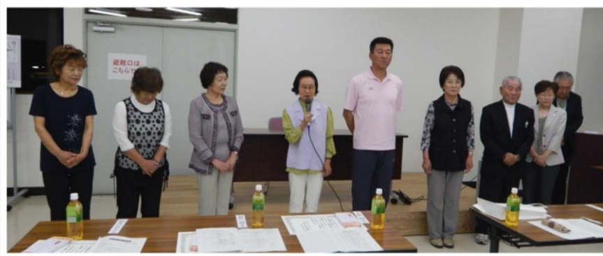
平成27年功労者表彰受賞者の皆様(10年~25年)