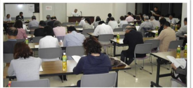
理事会で協議する出席者