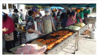
フランク焼きました、好評餅つきお疲れ様で