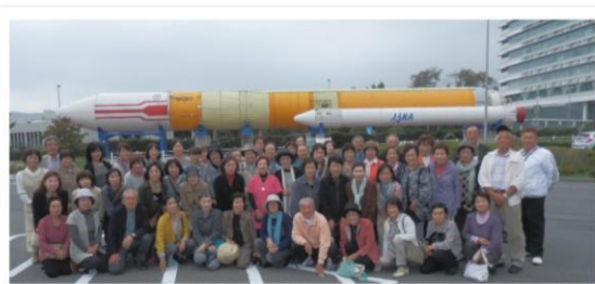
紫塚地区社会福祉協議会設立30周年