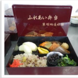
ふれあい弁当の出来上がり