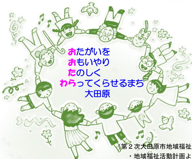
(第2次大田原市地域福祉計画 ・地域福祉活動計画より)

このようなことを意識することで、「地域ぐるみのふくし共育」が形作られると思います。今後も各地域で様々な人たちが協力し合いながら、「ふくし共育」の取組みを進めていただければと思います。